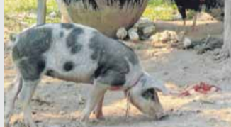
Die Schweine in Burma helfen den Familien.