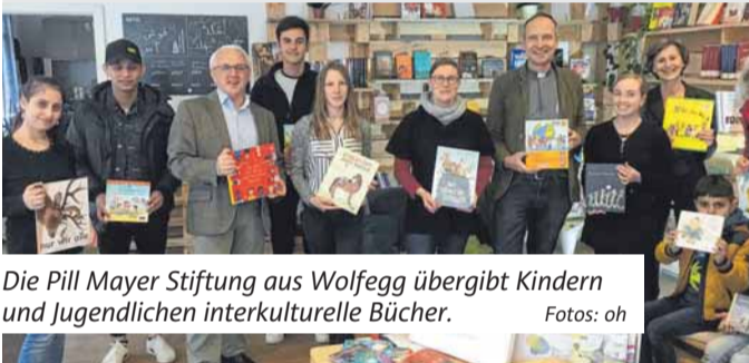
Die Pill Mayer Stiftung aus Wolfegg übergibt Kindern und Jugendlichen interkulturelle Bücher.